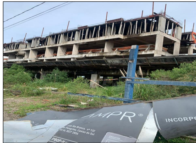
01. Colina Ducale (AMPR)

Registros fotográficos realizados durante a visita in loco às obras das Devedoras