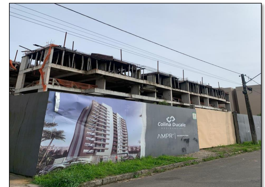
06. Sede administrativa da incorporadora