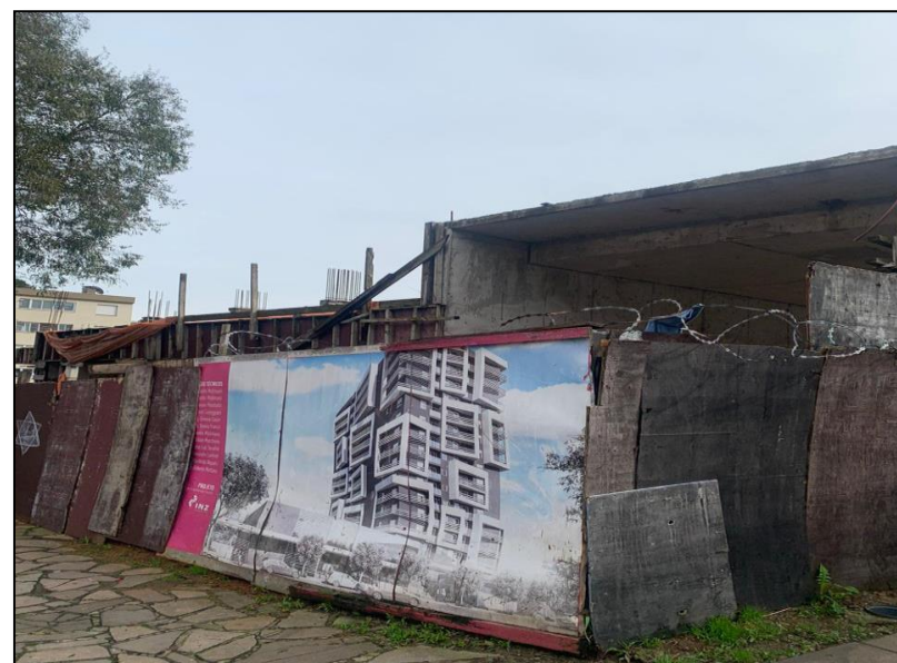
04. Update São Pelegrino (AMPR)