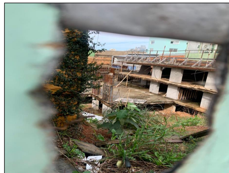
05. Update Centro (AMPR)