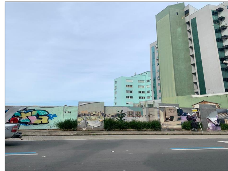
02. Update Centro (AMPR)