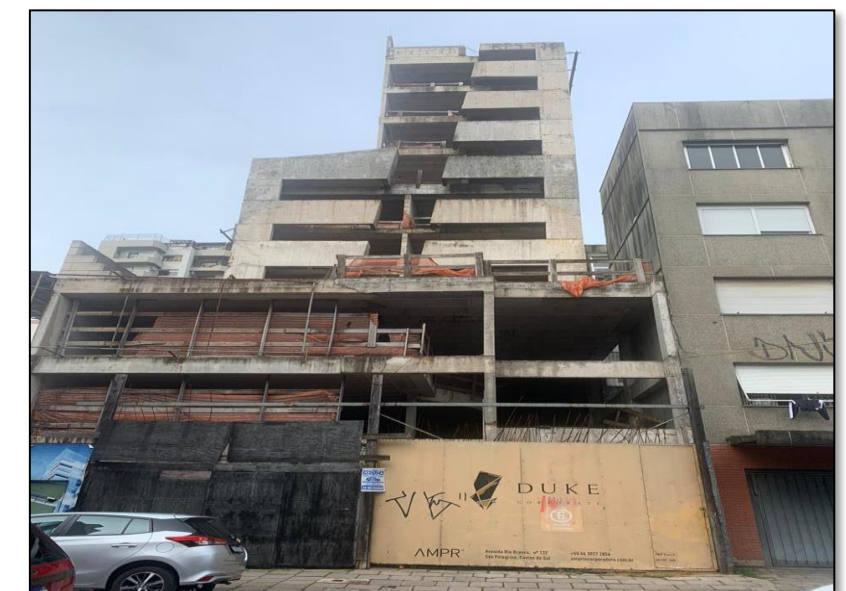
03. Duke (AMPR)