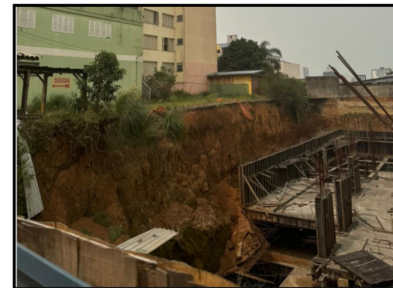
03. Update Centro (AMPR)