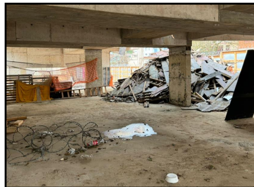
05. Update São Pelegrino (AMPR)