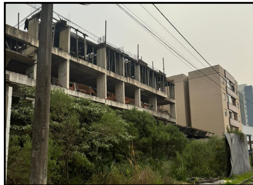
01. Colina Ducale (AMPR)

Registros fotográficos realizados durante a visita in loco às obras das Devedoras no dia 11/09/2024