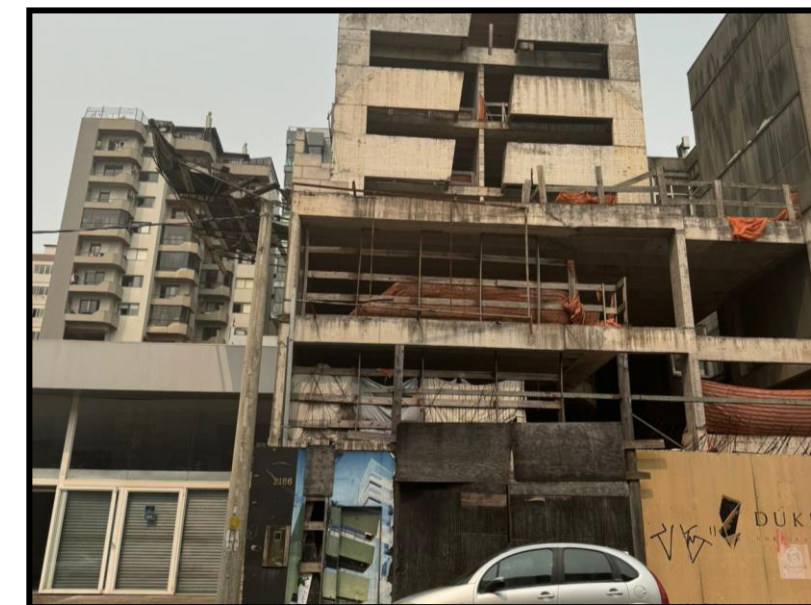
06. Duke (AMPR)