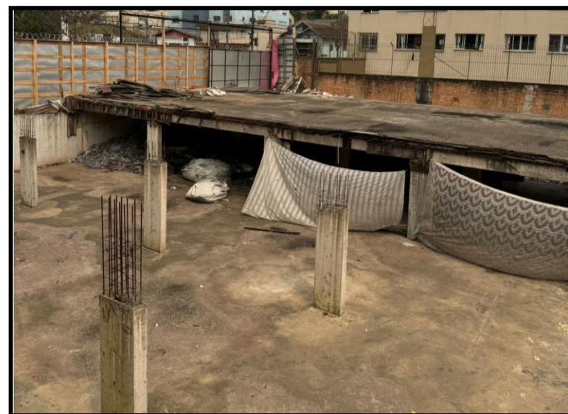
04. Update São Pelegrino (AMPR)