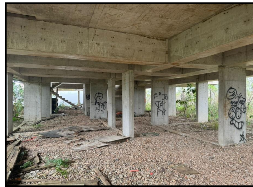
02. Colina Ducale (AMPR)